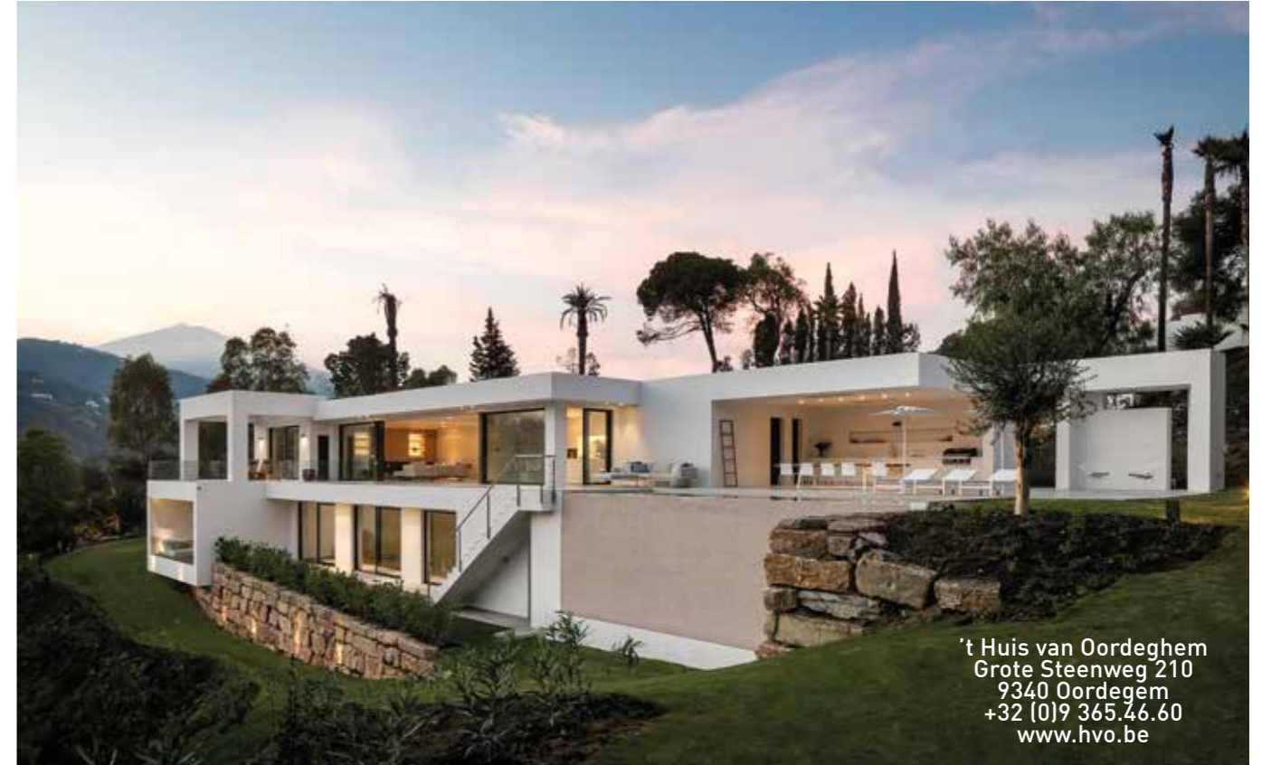
't Huis van Oordeghem Grote Steenweg 210 9340 Oordeghem +32 (0)9 365.46.60 www.hvo.be

in de grootst denkbare waaier aan texturen, tinten en toetsen tastbaar maken. 't Huis van Oordeghem doet enkel een beroep op leveranciers die meestappen in dit streven naar het nec plus ultra en daardoor leidt elk project opnieuw tot een bijzonder resultaat.